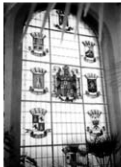
Figura 2. Vidriera. Palacio provincial.

Junto a los retratos, por encima de la tribuna, aparece una inscripción: “GLORIA / AL / EJÉRCITO / 18-JULIO-1936 / ¡¡VIVA FRANCO!!”. Es