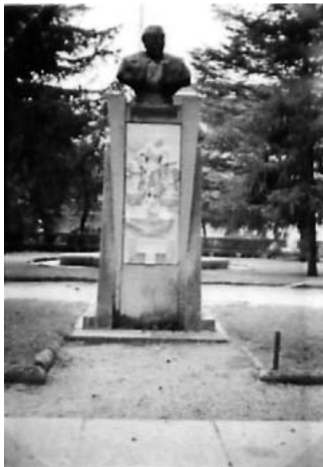
Fig. 3. Monumento a Carlos Pinilla. Universidad Laboral.

lo que queda del homenaje tributado al ejército con ocasión del ascenso a coronel del cabecilla de la sublevación en Zamora, Raimundo Hernández. Fue descubierta durante la celebración del primer aniversario del alzamiento militar 25 .