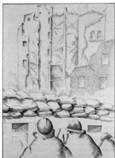
La defensa de Madrid sirvió de inspiración a poetas y escritores: símbolo para intelectuales de todas las latitudes.