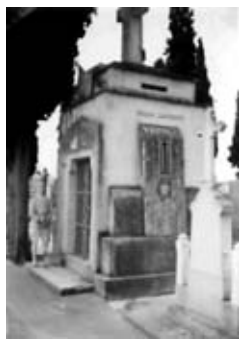
Figura 1. Panteón de la familia Sanvicente. Cementerio.