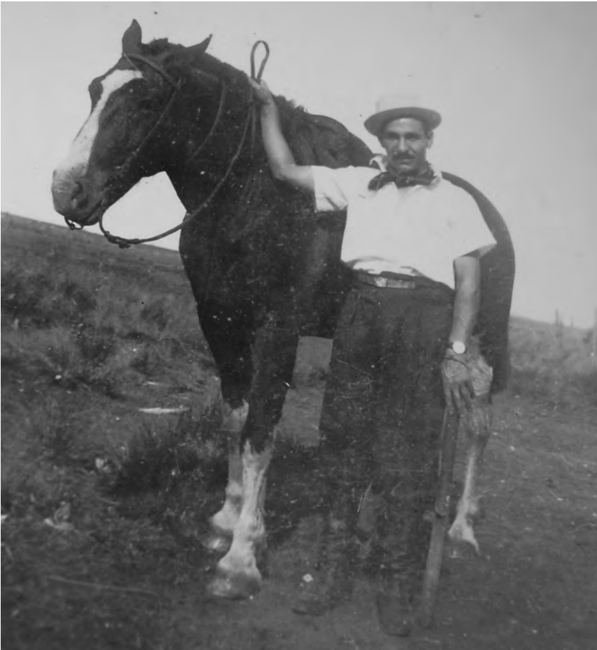
El autor en la Pampa

nieve. Yo siendo muy niño recuerdo hoy el dolor que me ocasionaba en las manos ese frío intenso. Otra alternativa era alimentar a la hacienda con paja de garbanzos que se guardaba para la ocasión, luego de haberlos trillado en verano.