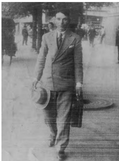
Mi padre haciendo gestiones en la ciudad de Buenos Aires en el año 1926.

Como lo había prometido, en febrero de 1992 viajé, en compañía de mi esposo, a España. Me traslado a León, lugar de residencia de amigos y a