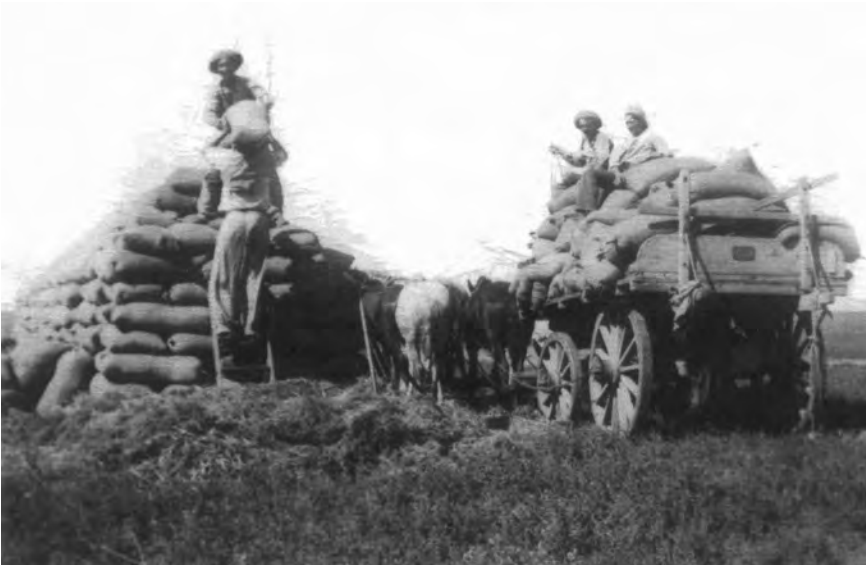
Recogida de cereal en La Pampa, 1940.

Esta historia tan común a la de miles de emigrantes, venidos de España o cualquier otro lugar de Europa, sin pretensiones de ganar o ni siquiera participar en ningún concurso literario, sólo sentí la necesidad de que yo, hija de emigrantes zamoranos, escriba contando a aquellos que hoy viven en su querida tierra algo de lo que recuerdo en cuanto a sus primeros años de venida a la Argentina y luego su futura vida formando una familia.