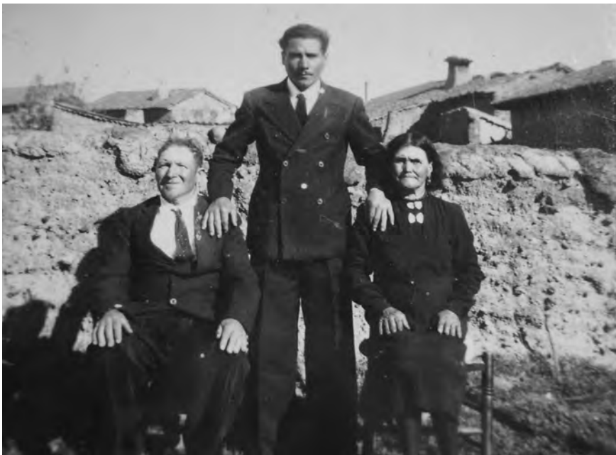
El autor con su padre en San Pedro de Ceque, 1949.